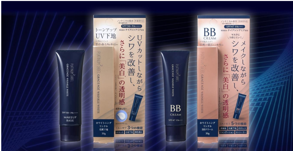
シワ改善・美白(*1)を叶える“薬用ホワイトニングリンクル”トーンアップ UV 下地&BB クリーム【医薬部外品】

生活関連用品の企画・開発・販売を行う株式会社ドウシシャ(大阪本社：大阪市中央区、代表取締役社長：野村 正幸)は、プラチナレーベルグレセージュから発売中の、『シワ改善』と『美白(*1)』の両方のケアを叶える“薬用ホワイトニングリンクル”シリーズに、「トーンアップ UV 下地」と「BB クリーム」の2アイテムを加え、2023年3月10日(金)より販売開始します。